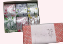
大地のおやつギフトセット (3個入)1,315～1,465円、 (6個入)2,484～2,784円