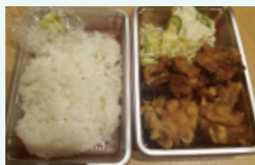
やみつき唐揚げ当 700円