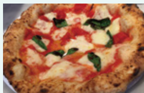
マルゲリータエクストラ 918円