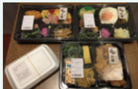
割烹黒潮の日替弁当 600円