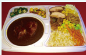
ビュッフェ弁当 650円