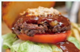
E・A・Tバーガーセット (ポテト・ドリンク付)1,566円