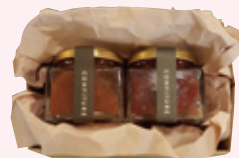
自家製ルバーブジャム詰め合わせ (ルバーブジャム 150g、 ルバーブと季節のフルーツのジャム 150g) 2,160円