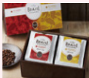
タリーズブラジルファゼンダパウ ビーベリーアソートギフトボックス 1,300円