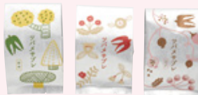
ツバメサブレギフト (3個入)1,380円、(6個入)2,760円