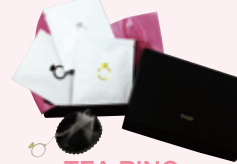
TEA RING (ストレート、ジンジャー、バナナ各2袋)2,133円